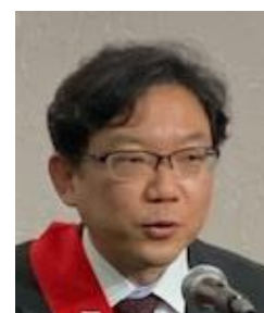
転勤による退会挨拶