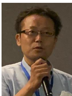
株式会社 アジュダンテ